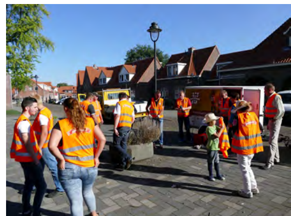
Opschoondag september 2016

Ook in Pathmos zijn hondenpoep en zwerfvuil grote ergernissen van bewoners. Een werkgroepje van bewoners gaat hiermee aan de slag. Alifa en Stadsdeelbeheer helpen daarbij.