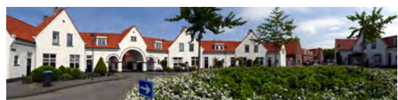
De karakteristieke toegangsbogen

Pathmos heeft een tuindorpachtige sfeer en heel karakteristieke woningbouw, met enkele bouwkundige pareltjes: o.a. de Pathmoschool, (voormalige) winkelpanden en diverse toegangsbogen.